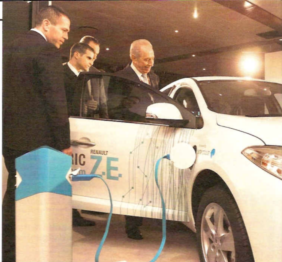
U startu myšlenky na unikátní projekt výroby a dobíjení elektromobilů izraelské firmy Better Šimon Peres.

Ale kdoví, třeba její děti už povinně na vojnu nebudou muset. ■