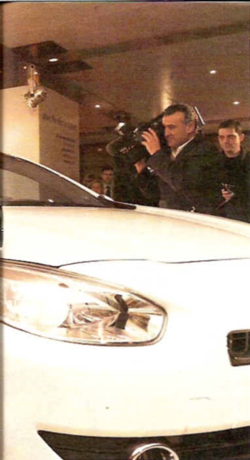
Place stál i izraelský prezident